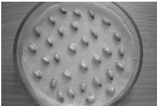
Рис. 1. Зерновки пшеницы на 7-е сутки проращивания в ходе стандартной методики определения всхожести

ных агаризованных питательных средах 9–34% изолированных зародышей невсхожих семян пшеницы прорастают. Как видно из табл. 1, количество проросших зародышей на контрольной среде МС было значительно большим, чем на других средах и на 32-е сутки проращивания составило 34% от количества высаженных зародышей.