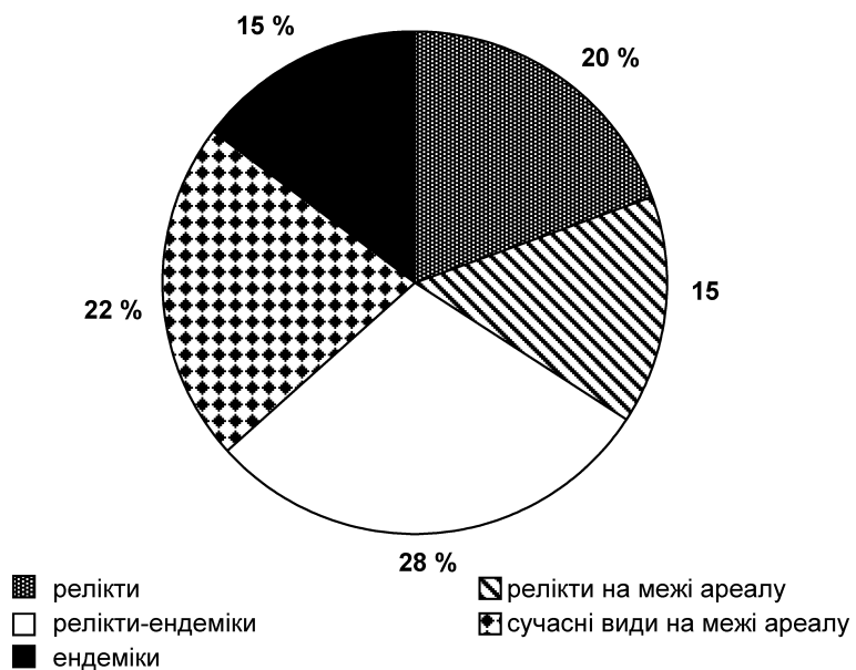
Рис. 2. Спектр видів за науковим значенням

Аналіз наукового значення видів деревно-чагарникових рослин ЧКУ дає змогу виділити основні джерела інтродукційного матеріалу та визначитися з методами практичної інтродукції (рис. 2).