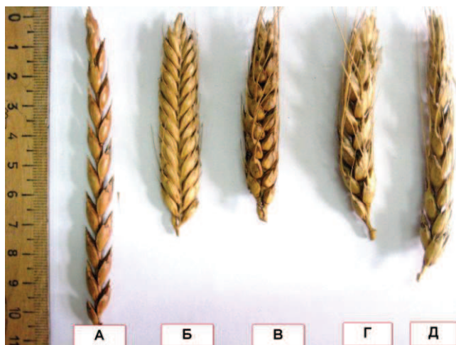
Рис.1. Довжина колосу різних пшениць: А — T. spelta var. duhame-lianum ; Б — T. macha Decarp. et Menabde; В — T. aestivum L. subsp. sphaerococcum сорт Шарада; Г — T. aestivum сорт Куяльник; Д — T. aestivum сорт Селянка

Як видно з представлених даних, за довжиною та щільністю колосу пшениця маха та сорти м'якої пшениці Селянка і Куяльник достовірно не відрізнялися між собою. За довжиною колосу та кількістю колосків у колосі пшениця спельта ( T. spelta L.) випереджала інші генотипи, але мала найменшу щільність колосу. Колоси шарозерної пшениці ( T. aestivum L. subsp. sphaerococcum ) сорту Шарада відрізнялись найбільшою щільністю порівняно з іншими голозерними та плівчастими пшеницями.