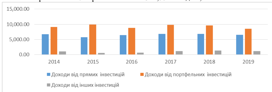
Рис. 2. Динаміка доходів від інвестицій, які були залучені до Данії, млн. дол.

Інші інвестиції також є одним із основних джерел отримання доходів в Норвегії, і є більш стабільними. В 2018 році доходів від інших інвестицій було перераховано на суму 8 859,36 млн. дол., і 2018 був єдиним роком, коли було зафіксовано невеликий ріст доходів. У всі інші роки відбувався спад доходів від інших інвестицій. Загальне зменшення в порівнянні з 2014 роком склало 2 342,55 млн. дол., або 21%.