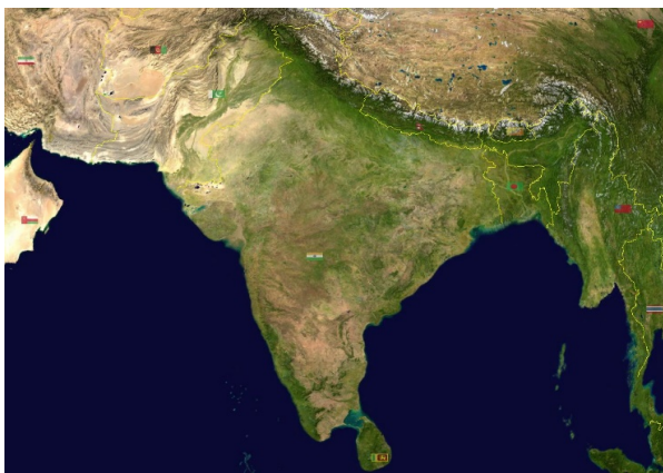
Мал. 1 Фізична мапа Індостану

Останнє, що варто знати про економіку Індії – це її географічний аспект. Як можна побачити на мал. 1 півострів Індостан на суші з усіх боків оточений горами – на півночі Гімалаї, вище хребтів на Землі немає, на північному заході гірські хребти чергуються із пустелями, а на північному сході – із непрохідними джунглями. Словом, Індія повністю ізольована від світу через сушу. Ця ізольованість тільки збільшується, якщо додати аспект політичний: на півночі знаходиться Китай, на північному заході – Пакистан. Перший – конкурент за владу в регіоні, другий – ворог, із яким майже не вщухають прикордонні сутички. Це все спрямовує погляд Індії до океану. Саме через нього Індія отримує свій імпорт і може розвиватись всупереч сусідам. Там знаходиться вікно для поширення впливу у навколишній світ. І тому Індійський океан – життєвий простір Індії, а домінування в цьому регіоні – одна з наріжних складових її зовнішньої політики.