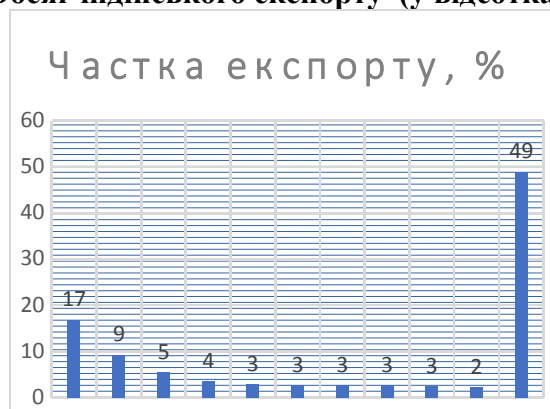
Діаграма 2 Обсяг індійського експорту (у відсотках)