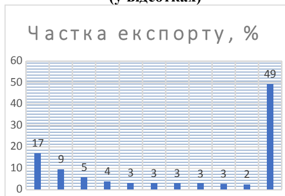
Діаграма 1 Обсяг індійського імпорту в країнах (у відсотках)