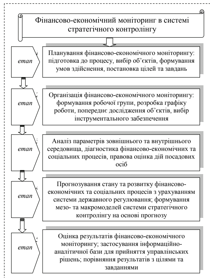
Рис. 3. Етапи фінансово-економічного моніторингу в системі стратегічного контролінгу

Етапи реалізації фінансово-економічного моніторингу у системі стратегічного контролінгу, які представлені на рис. 3, складаються з окремих підготовчих, аналітичних та оціночних дій, які базуються на методичних підходах та враховують чинну нормативно-правову базу, що забезпечує збалансованість інтересів серед суб'єктів мікро-, мезо- та макроекономічного середовища, враховуючи векторіальну спрямованість державної політики.