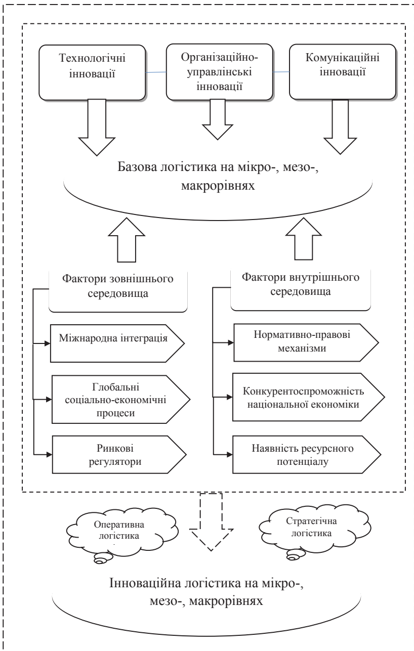
Рис. 1. Процес формування інноваційної логістики