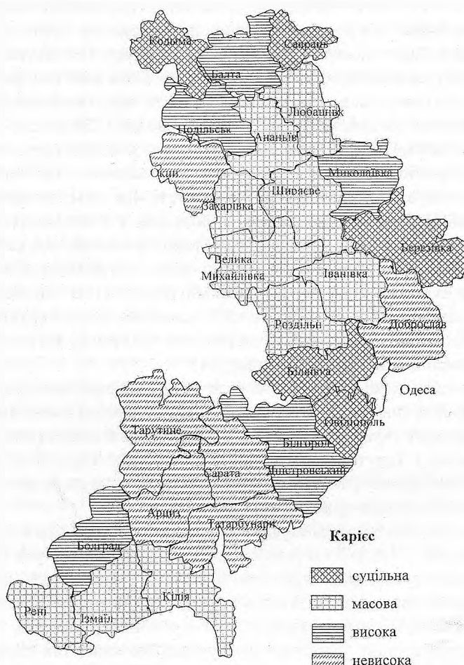
Рис. 2. Ступінь ураження населення Одеської області карієсом Fig. 2. Degree of affection of the population of Odessa region with caries

Дослідженнями вчених Інституту стоматології Академії медичних наук України (м. Одеса) щодо захворюваності дитячого населення області деякими стоматологічними патологіями виявлено, що існують певні закономірності поширення карієсу та флюорозу зубів залежно від вмісту фтору у питних водах [2; 5; 7; 9–11; 13; 15; 21]. Зокрема, захворюваність населення на карієс зубів виявлено у всіх районах області (рис 2). Причому у 4-х районах (загалом у 3-х вікових групах: 7, 12 і 15 років) відзначається суцільна поширеність карієсу зубів (за градацією ВООЗ) – це Біляївський, Березівський, Кодимський і Савранський райони [11]. Зазначені райони мають доволі низький вміст фтору у питних водах ( <0,3 мг/дм 3 ). У 10-ти районах визначено масову поширеність карієсу – Ренійському, Ізмаїльському, Кілійському, Роздільнянському, Іванівському, Велико-Михайлівському, Ширяївському, Захарівському, Ананьївському, Любашівському.