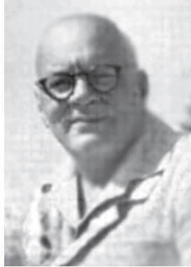
Рис. 1. А.М. Криштофович в Одесі. 50-ті роки ХХ ст. [2]

У хронологічному порядку наведені найбільш видатні події у житті А. М. Криштофовича, які дозволили йому стати унікальним вченим.