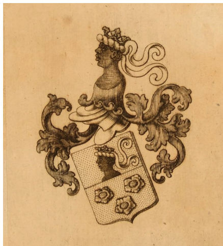
Ил. 2 (Приложение 2, № 2)