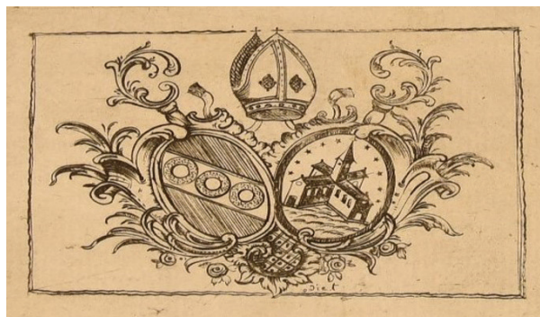
Ил. 3 (Приложение 2, № 3)