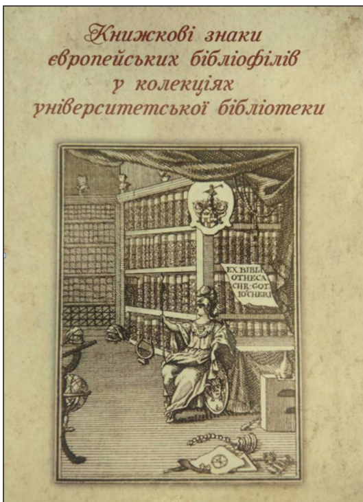
Іл. 1. Обкладинка. В оформленні використано відбиток книжкового знаку Християна Готліба Йохера з видання «Tatiani Oratio ad Graecos...» (Оксфорд, 1700)