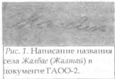
Рис. 1. Написание названия села Жалбае (Жалнтай) в документе ГАОО-2.

39. Султан-Мурат-Авлы, Sultan Murat. Локализовано верно (№ 30). Между совр. сс. Иорлановка и Чукур-Минджир.