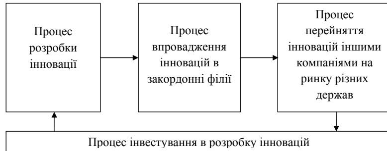
Рисунок 1 Процес розробки інновації

Інноваційна діяльність - це діяльність, спрямована на використання і комерціалізацію результатів наукових досліджень та розробок і зумовлює випуск на ринок нових конкурентоспроможних товарів і послуг [5]. ТНК є найважливішими учасниками інноваційної діяльності та інноваційного процесу в державах. Однією з головних рис сучасних ТНК є їх масштабні витрати на НДДКР. Процес розробки інновації у спрощеному виді відображено на рисунку 1.