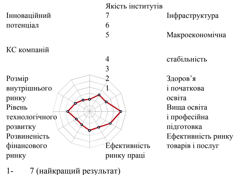
Рисунок 1 Індекс глобальної конкурентоспроможності України (джерело: [4])

Отже, підсумком шляху до незалежності, протяжністю майже чверть століття, стала реальна загроза втрати цієї незалежності з усіма її основними аспектами, через втрату економічного потенціалу, розбалансованість фіскальної, платіжної і енергетичної систем, фактичну неплатоспроможність. Де-факто, втраченою є не лише