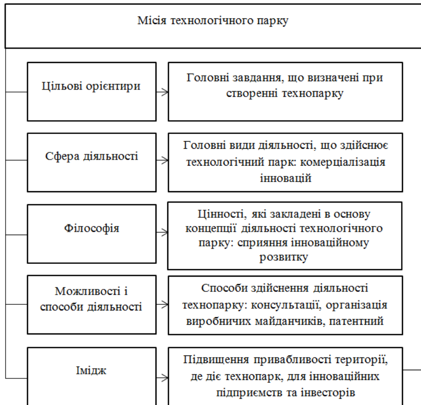
Рисунок 2 – Місія технологічного парку при реалізації державної інноваційної політики

Головна місія технопарку зображена на наступному рисунку (рис. 2) та полягає у тому, що, при ефективній організації, технопарки сприяють появі нових інноваційних підприємств, стимулюють структурну перебудову економіки в межах території, де їх організовано, позитивним чином здійснюють вплив на індустріальні зрушення, підсилюють розвиток реального сектора економіки, сприяють появі нових робочих місць.