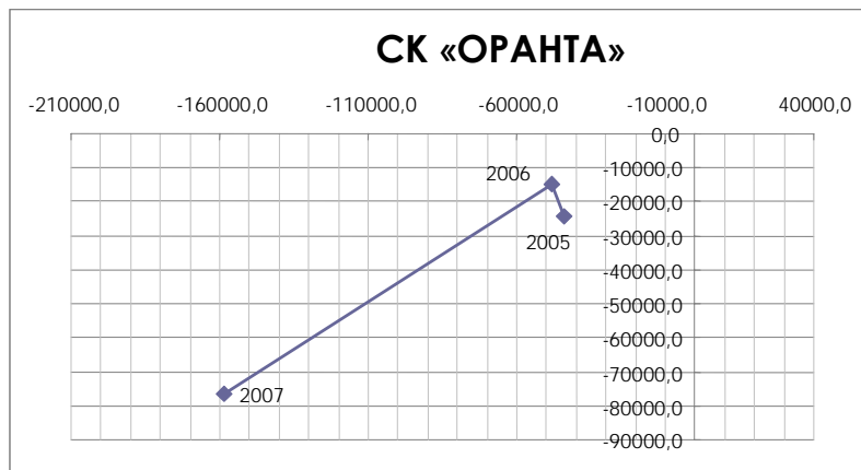
Рис. 3. Точка суперстійкості СК «Оранта», 2005 – 2007 рр., тис. грн.

Висновки та перспективи подальших досліджень. Узагальнюючи результати, що були отримані за різними методиками оцінювання фінансового стану страхової компанії «ОРАНТА», можна зробити висновок, що жодна з методик не дає адекватної оцінки діяльності страхової організації, не враховує особливості страховика та потребує доопрацювання.